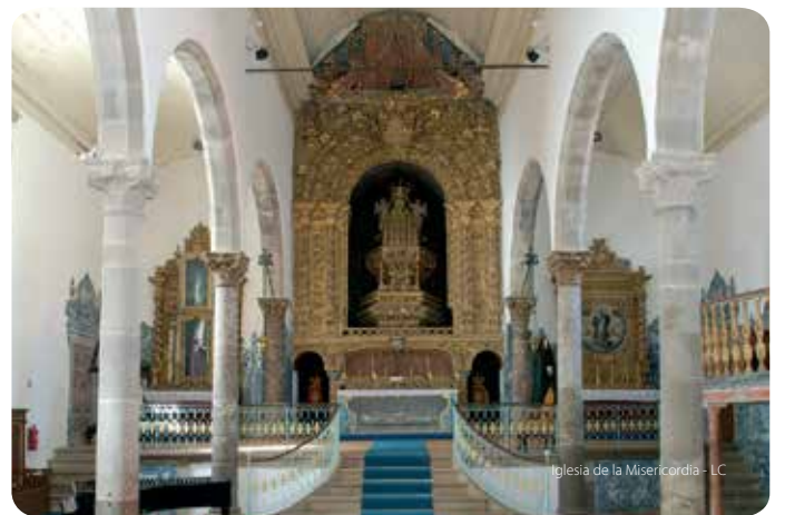
Iglesia de la Misericordia - LC

En la sacristía una imagen del Señor Crucificado, posiblemente del siglo XVI, junto a un pequeño claustro.