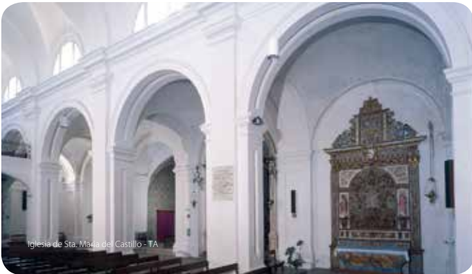
Iglesia de Sta. Maria del Castillo - TA

Probablemente construida en el lugar de la antigua mezquita. Edificio del siglo XIII con alteraciones posteriores, en parte provocadas por el terremoto de 1755. Portal gótico, con capiteles de ornamento vegetal. En el exterior, existen otros elementos góticos: ventanas ojivales y pequeño rosetón, perros y gárgolas de cabecera. La torre del Relógio (Reloj) pertenece también a la construcción primitiva, aunque con adiciones decorativas posteriores. Interior de tres naves, con bóvedas. En la pared izquierda de la capilla mayor, el sepulcro de los siete Caballeros de la Orden de Santiago muertos por los moros en una emboscada, razón de la conquista de la ciudad. En la tribuna, una imagen de Nuestra Señora, de gran belleza (siglo XVIII). Capilla del Santísimo, paredes revestidas de azulejos historiados (siglo XVIII). Capillas de las Almas, retablo de talla que, en el elemento central, presenta iconografía religiosa en alto relieve (principios del siglo XVIII). Capela do Senhor dos Passos [Capilla del Señor de los Pasos], paredes revestidas de azulejos (siglo XVII) y retablo de talla (siglo XVIII). En la sacristía, azulejos del siglo XVIII, decorados con cestos de fruta y jarrones de flores. Del tesoro sacro, compuesto por piezas de orfebrería de los siglos XVI y XVIII y paramentos, merece ser mencionada especialmente una preciosa estantería de misal proveniente de Japón (arte "namban"), de los siglos XVI/XVII.