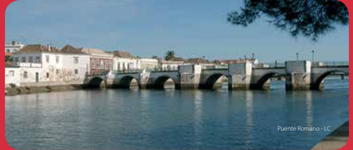
Puente Romano - LC