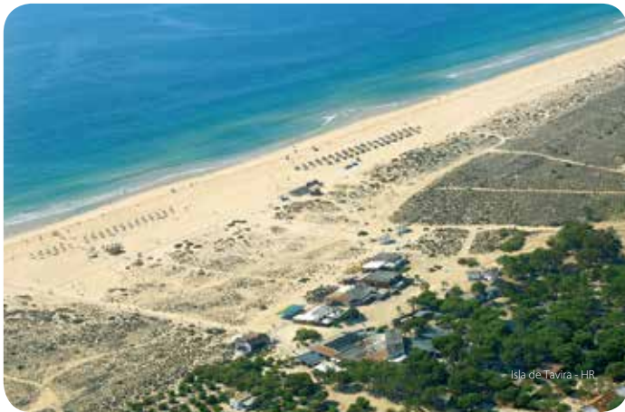
Isla de Tavira - HR

Inserta en el Parque Natural de la ría Formosa, es considerada una de las más bellas playas del Sotavento algarveño. Vasto arenal de arena blanca, se accede a través de líneas regulares de pequeñas embarcaciones desde las 4 Aguas y también desde el centro de la ciudad durante el verano. Equipamientos de apoyo y camping.