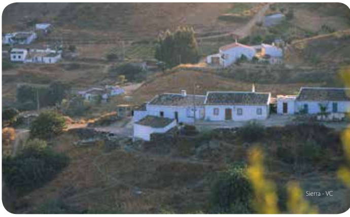
Sierra - VC