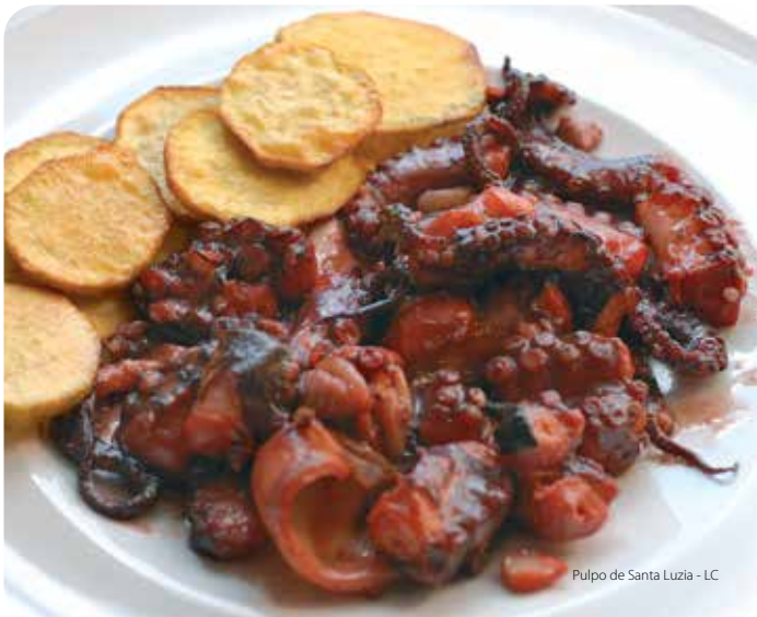
Pulpo de Santa Lucía - LC

Los vinos tintos de Tavira tienen el sabor del sol que madura las uvas, a las que enriquece de azúcar.