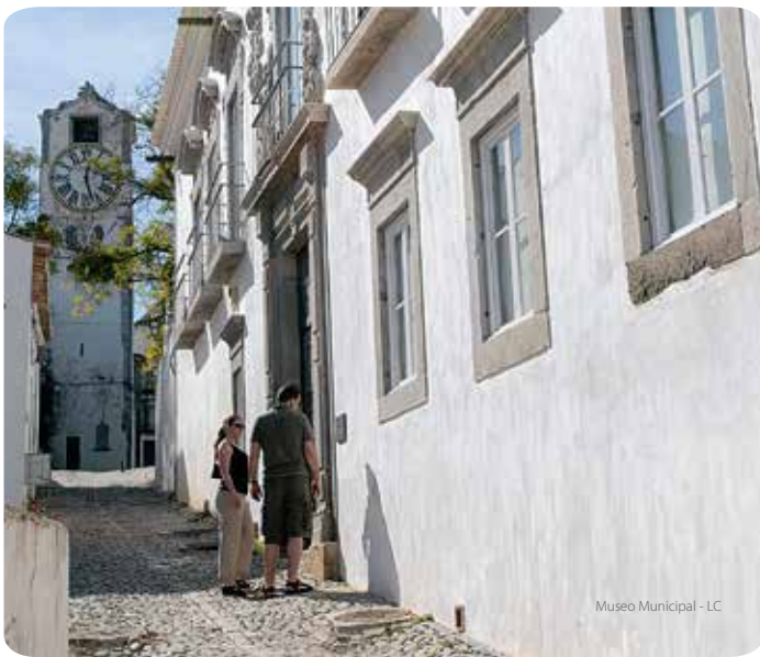
Museo Municipal - LC