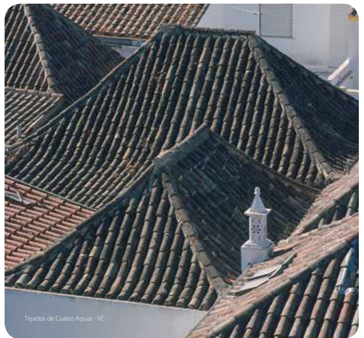
Tejados de Cuatro Aguas - VC