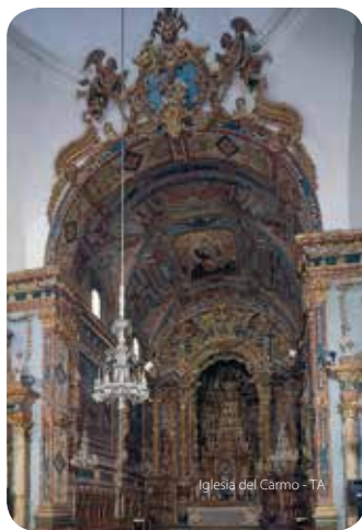
Igreja do Carmo - TA