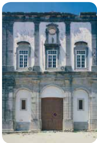
Igreja do Carmo - TA

Construida en la segunda mitad del siglo XVIII. Importante retablo de talla dorada en la capilla mayor que, junto con los retablos laterales, los cuadros, las imágenes, el sillón, el órgano y el tesoro sacro constituye un valioso ejemplo del arte barroco en el Algarve.