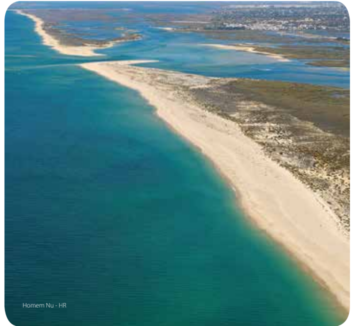
Homem Nu - HR

Está integrada en el Parque Natural de la ría Formosa y queda a 1500 metros de la última concesión de toldos, junto al terminal de trenes de Barril y en el sentido de la playa del Homem Nu (Hombre Desnudo).