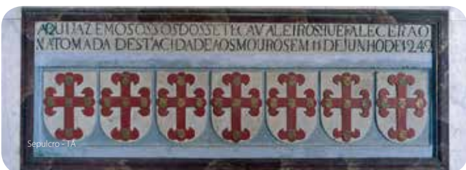
Sepulcro - TA