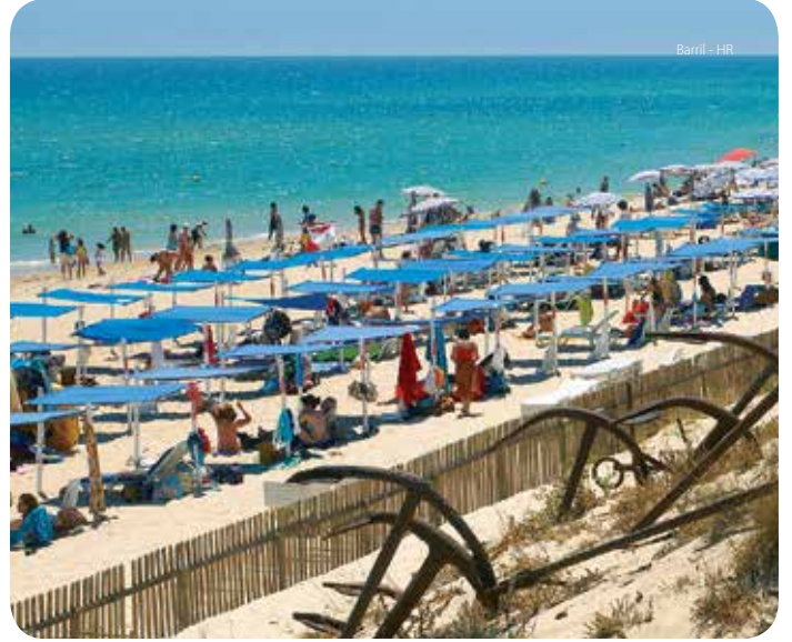
Barril - HR

Una de las más emblemáticas playas del municipio localizada enfrente al complejo turístico de las Pedras d'El Rei. Está compuesta por un extenso arenal, y su acceso puede ser hecho a pie o a través de tren turístico. Situada en la misma playa, se encuentra el antiguo Almacén de Atún que se remonta al año 1842. Su estado de conservación es muy bueno, y su espacio se ha reconvertido en área comercial. Próximo al Almacén se encuentra el famoso "Camposanto de las Anclas", cartel de visita de esta playa.