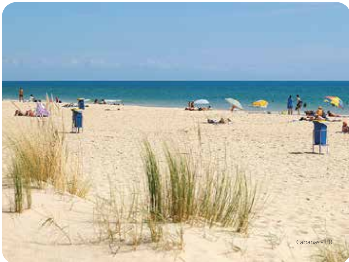
Cabanas - HR

Separada por un brazo de la ría Hermosa, esta playa separada y tranquila tiene acceso por barco. Existen equipamientos de apoyo. Junto a la ría se encuentra el antiguo Forte de San João da Barra, construcción poligonal del s. XVII/XVIII, actualmente propiedad particular.