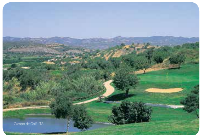
Campo de Golf - TA