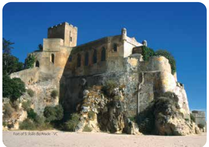
Fort of S. João do Arade - VC

Sur les falaises découpées de petites criques d'une grande beauté, on découvre au Pont da Atalaia et à la Quinta da Torre les vestiges de deux tours d'observation médiévales qui alertaient des attaques de pirates et de corsaires.