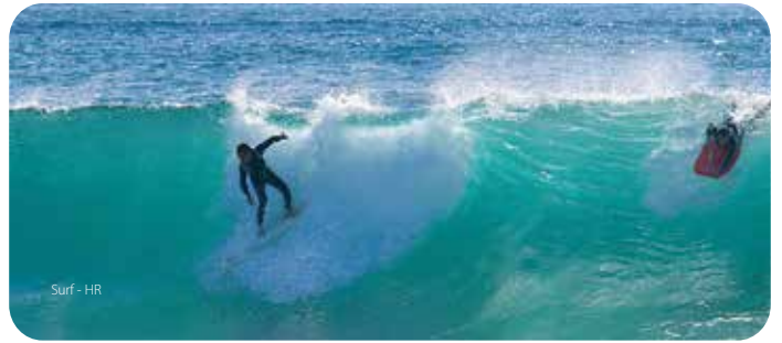
Planche à voile, voile, plongée, ski nautique, surf. Autant de sports que le littoral de Lagoa offre sur ses nombreuses plages. Pour des vacances revigorantes et actives.