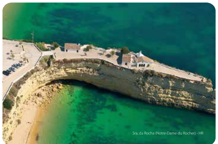
Sra. da Rocha (Notre-Dame du Rocher) - HR