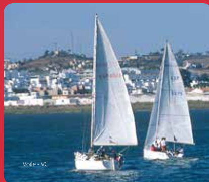
Voile - VC