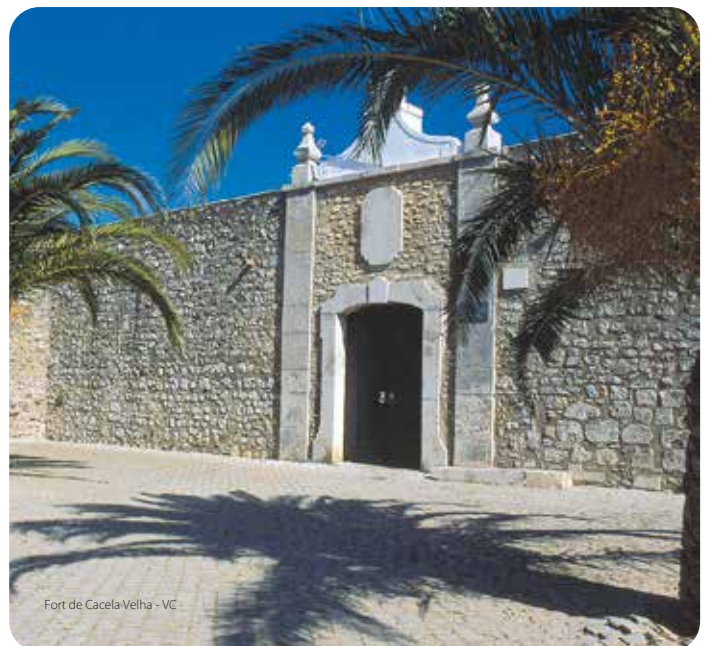
Fort de Cacela Velha - VC

De plan polygonal, il fut reconstruit à la fin du XVIII e siècle.