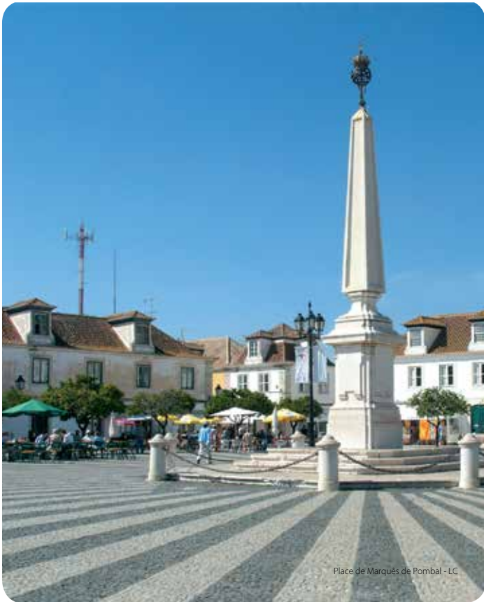
Place de Marquês de Pombal - LC

Pour apprécier le tracé de Vila Real de Santo António il faut parcourir ses rues, en commençant par la Praça Marquês de Pombal, coeur de la ville, aux pavés rayonnant à partir de l'obélisque dressé en 1776. Sur la place se trouvent trois des principaux éléments urbains du XVIII e siècle : l'église, la Mairie et l'ancienne Maison de la Garde (devenue aujourd'hui une banque). Il faut ensuite parcourir quelques pâtés de maisons, d'initiative privée mais où l'on distingue encore le même modèle architectural. La rangée de façades de l'Avenida da República, délimitée par deux tourelles et comprenant l'édifice de l'ancienne Douane, au large portail et au fronton triangulaire, constitue la fin du parcours. À côté, les jardins des berges du Guadiana face à la ville espagnole d'Ayamonte.