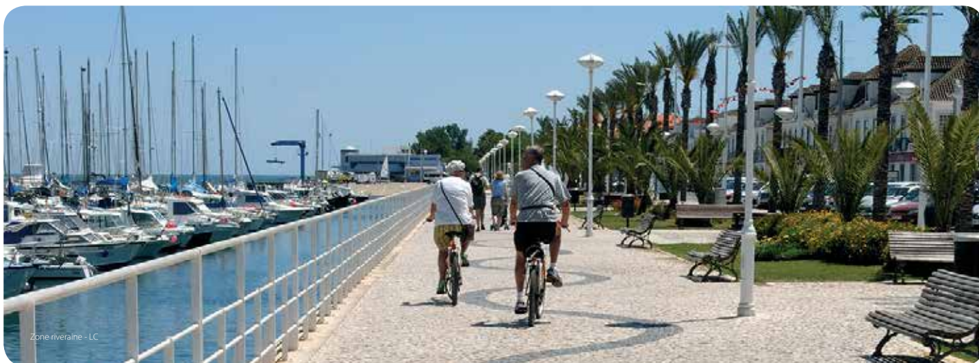
Zone riveraine - LC