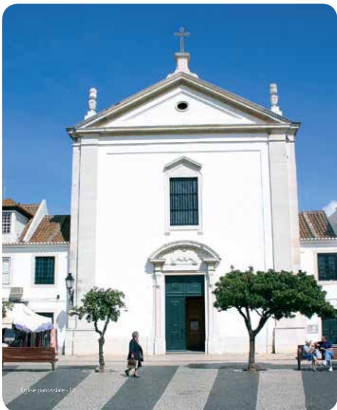
Église paroissiale - LC

Construite au XVIII e siècle, elle subit des travaux de restauration au cours des années 1940 et 1950. Retables des chapelles latérales en style rocaille. Bel ensemble de statues du XVIII e siècle, en particulier une Nossa Senhora da Encarnação (Notre-Dame de l'Incarnation) sculptée par Machado de Castro. Les vitraux du choeur et du baptistère installés dans les années 1940 ont été peints par Joaquim Rebocho, peintre de la région.