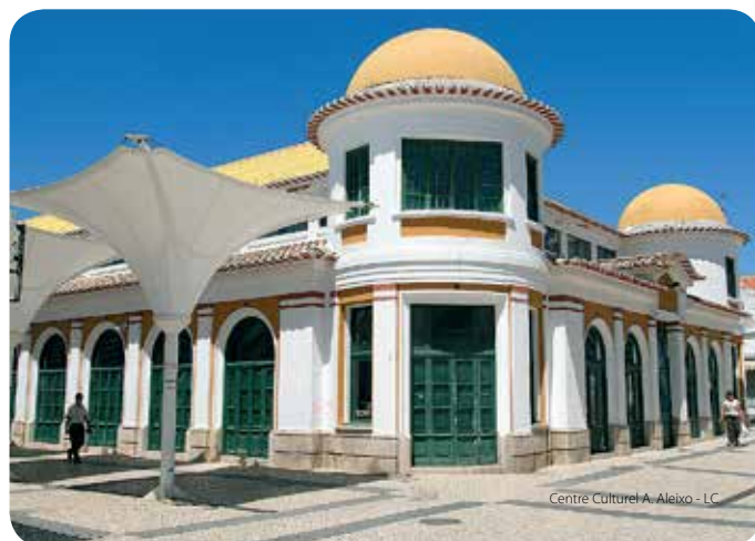
Centre Culturel A. Aleixo - LC

Au XVI e siècle, il exista, probablement plus près de la mer, le bourg de Santo António de Arenilha qui, au XVIII e siècle, avait disparu englouti par la mer et le sable. Pourtant, il fallait bien contrôler l'entrée des marchandises par le Guadiana, placer sous la supervision royale les industries de la pêche de Monte Gordo et faire face à l'Espagne, contre laquelle elle avait été en guerre en 1762/1763. La construction de Vila Real de Santo António présentait d'évidents avantages économiques et politiques et fut donc plus qu'un simple acte de la volonté royale.