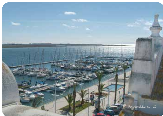
Port de plaisance - LC

La reconstruction de Lisbonne après le tremblement de terre de 1755 servit de modèle à Vila Real de Santo António. D'abord, dans le plan rigoureux de la structure urbaine, facilitée par le terrain plat. Enfin, dans l'utilisation de modules architecturaux rigides. Enfin, dans la préfabrication d'éléments de construction standardisés, comme les encadrements de portes et fenêtres qui vinrent de Lisbonne, par bateau, taillés et prêts à poser.