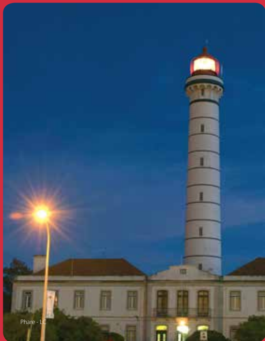
Phare - LC